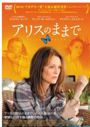
(C) 2014 BSM Studio. All Rights Reserved.