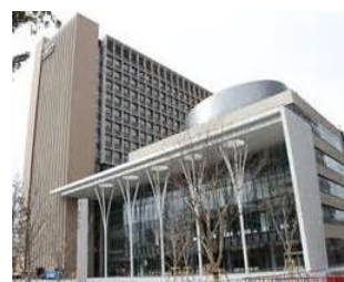
明治大学中野キャンパス